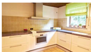
Täuschend echte Küchennachbildung.