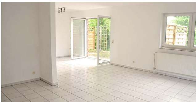
Leerer Wohnraum, vor dem Home Staging.

Allerdings, Home Staging ist (k)eine Kunst! Einerseits müssen Immobilien so präsentiert werden, dass diese dem gesellschaftlichen Trendempfinden entsprechen und andererseits sollen Räume so gestaltet sein, dass diese dem Interessenten noch genug Freiraum für die eigene individuelle Vorstellungskraft bieten.