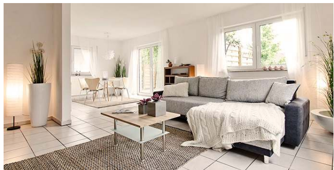
Wohnraum nach dem Home Staging.